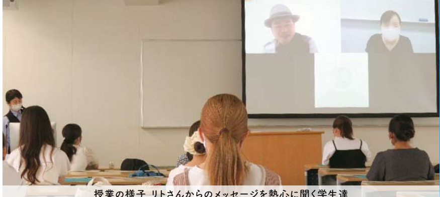
授業の様子 リトさんからのメッセージを熱心に聞く学生達