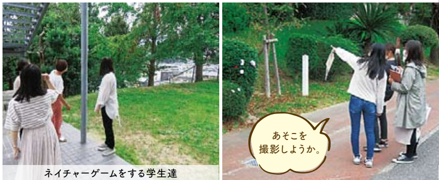
ネイチャーゲームをする学生達