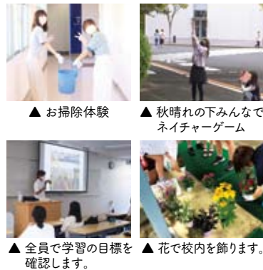
▲お掃除体験 ▲秋晴れの下みんでネイチャーゲーム ▲全員で学習の目標を確認します ▲花で校内を飾ります。

昨年度より本学でスタートした保育基礎1・2の授業です。2年目は更に充実した活動となっています。保育士としての様々な基礎力や実践力を育むための1年次の授業となっています。