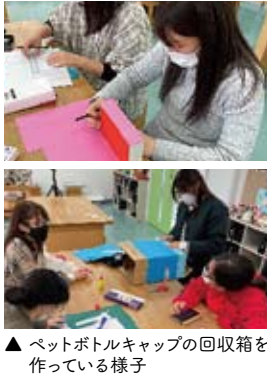
▲ペットボトルキャップの回収箱を作っている様子

1年生が発案してサークル活動として「ボランティアサークル」を立ち上げました。ペットボトルキャップ集めを始めさまざまな計画をしています。現在メンバーは11名でのスタートですが、今後メンバーが学科を超えて広がっていく事と思っています。