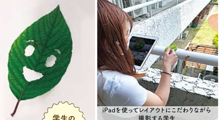
iPadを使ってレイアウトにこだわりながら撮影する学生