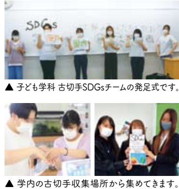
子ども学科 古切手SDGsチームの発足式です。 ▲学内の古切手回収場所から集めてきます。

SDGs活動の一環で、学内で使用済み切手の回収を始めました。使用済み切手は、「世界の子どもにワクチンを」日本委員会に送られ、その販売益を途上国の母子保健に役立てられます。自分たちができることから始めています。