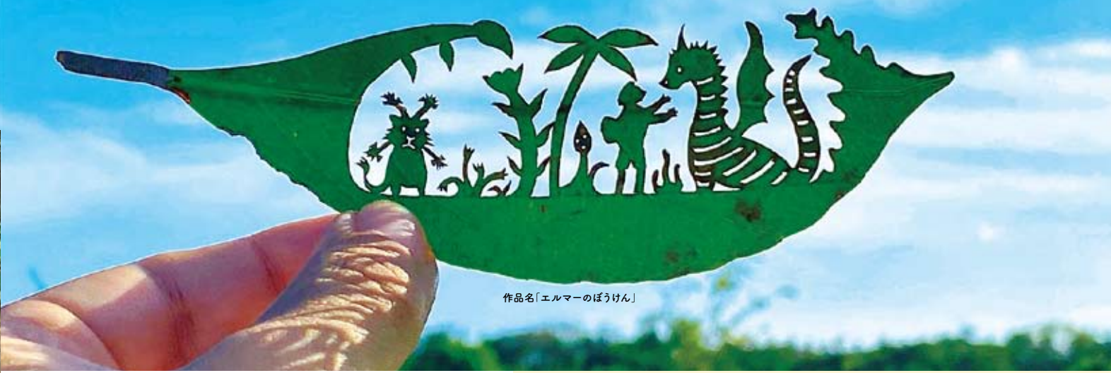
作品名「エルマーのぼうけん」