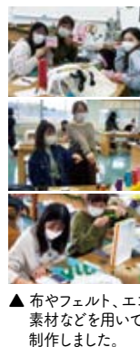
▲布やフェルト、エコ素材などを用いて制作しました。

普段は実習体験や子どもたち対象の企画を実施することで園児さんと学生とが交流できる機会がありますが、今年も昨年に続いて新型コロナウイルス感染症防止対策のために行事の制限が多く、交流の機会がほとんどなくなりました。そこで保育基礎の授業の中で附属野方幼稚園をはじめ、いくつかの保育園・幼稚園園児さんにご協力をいただき、学生達が園児さんのことを考えながら製作して遠隔での交流の場をもてるように計画しました。できあがった製作物は、幼稚園の園児さん達にプレゼントしました。