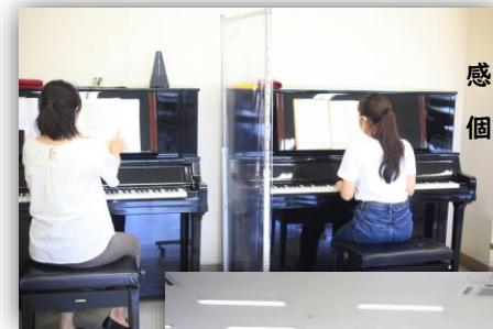
感染対策を講じた 個人レッスンの様子♪