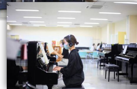
空き時にはピアノを自由に使えます♪