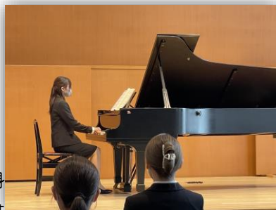
風早ホールでの発表会♪

音楽科の教員・非常勤講師とのチームティーチングを行っています。個々の音楽力に沿った個別レッスンを実施し、現場で活かせる音楽力を身に付けていきます。また、本学のオンラインシステムを利用して、音楽の基礎である楽典の学びも深めます。